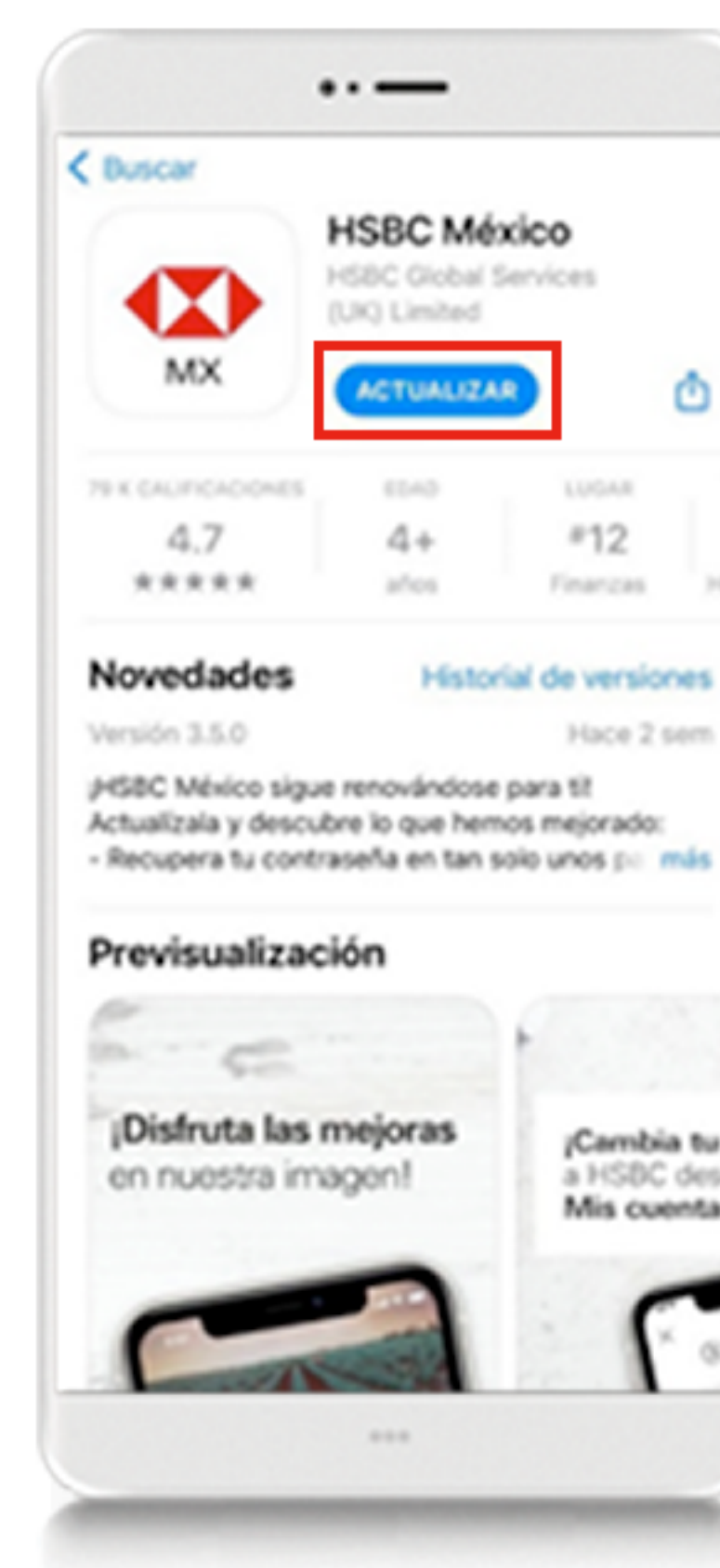
App Store Sistema operativo iOS

Si tienes iOS y no te aparece la opción de actualizar, sino abrir, te recomendamos hacer clic en el logo de HSBC México 1 .